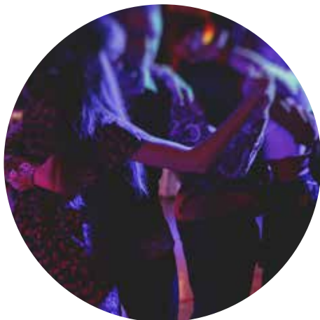
© Shutterstock Tsugajev / VL Bodenseeschiffahrt