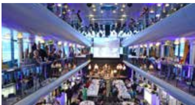
© Ann Katrin Plangger, Wolfgang Oberschelp